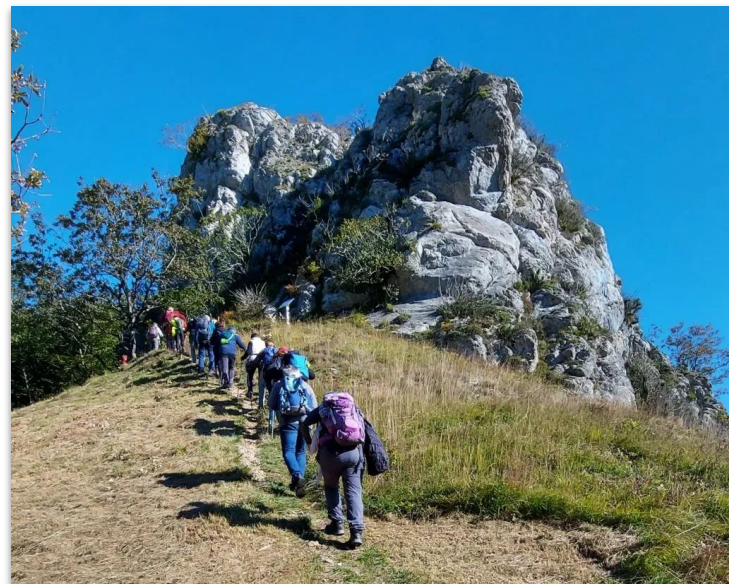
Nombreuses randonnées (sur la photo, Mont Poupet à 20km) depuis Port-Lesney (5km), La-chapelle-sur-Furieuse (10km), Mouchard (5km), etc.