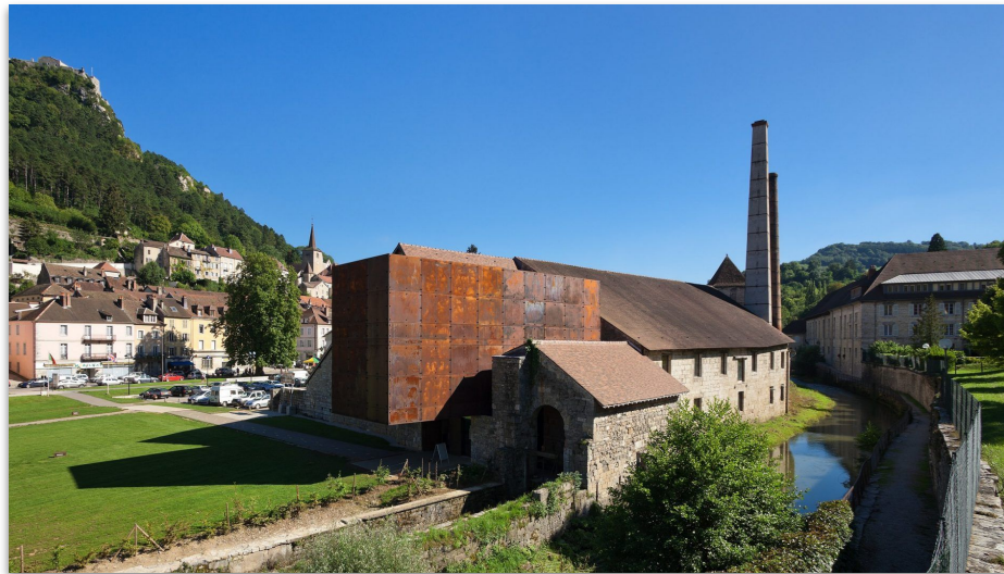
Salins-les-Bains, avec ses Salines et ses thermes (15km)