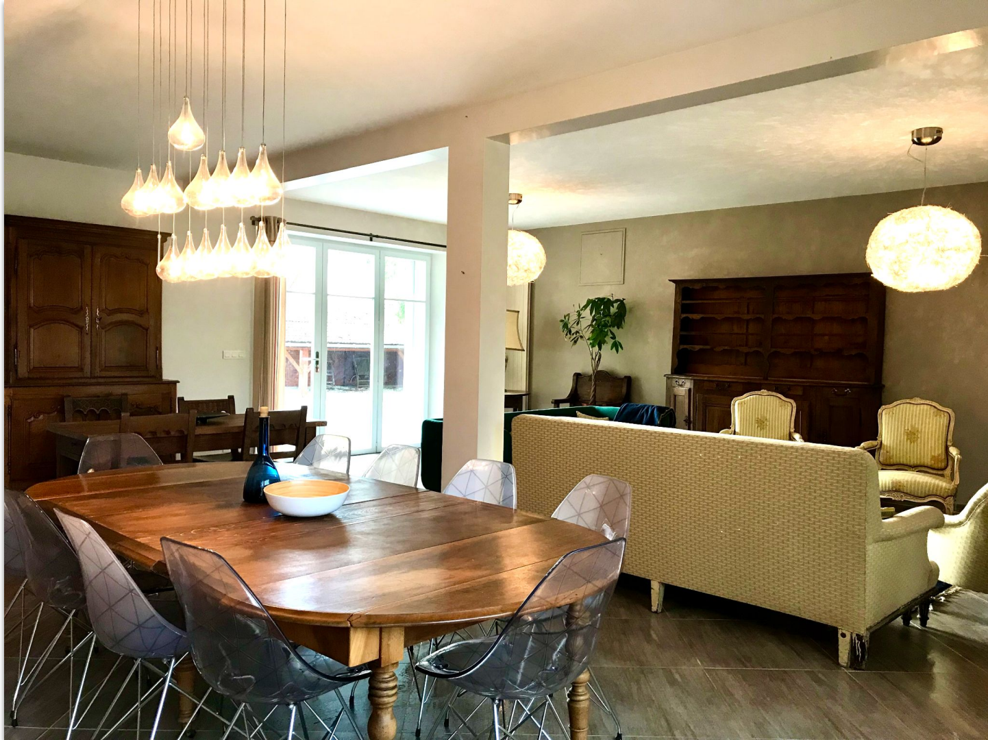
RDC : Grande pièce à vivre avec deux portes sur l'extérieur