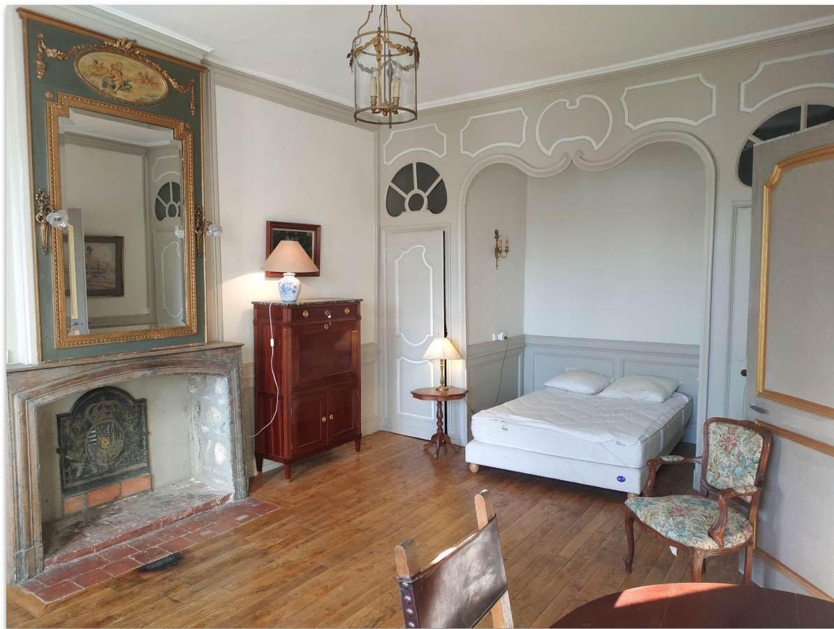
chambre double (accès à une 2ème salle de bain)