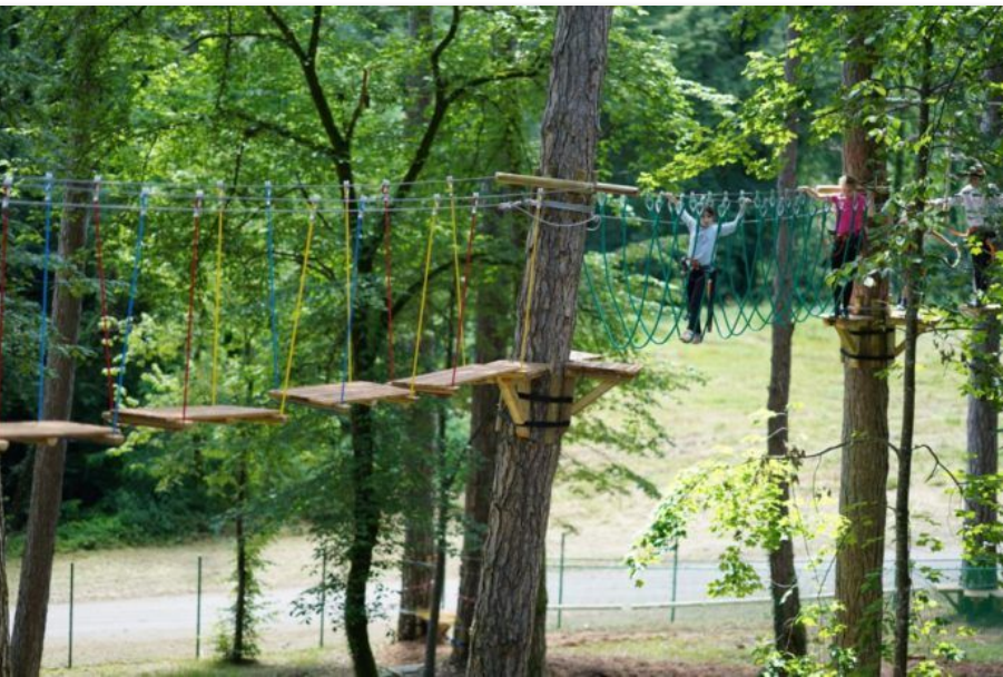
Accrobranche à Salins-les-Bains (15km)