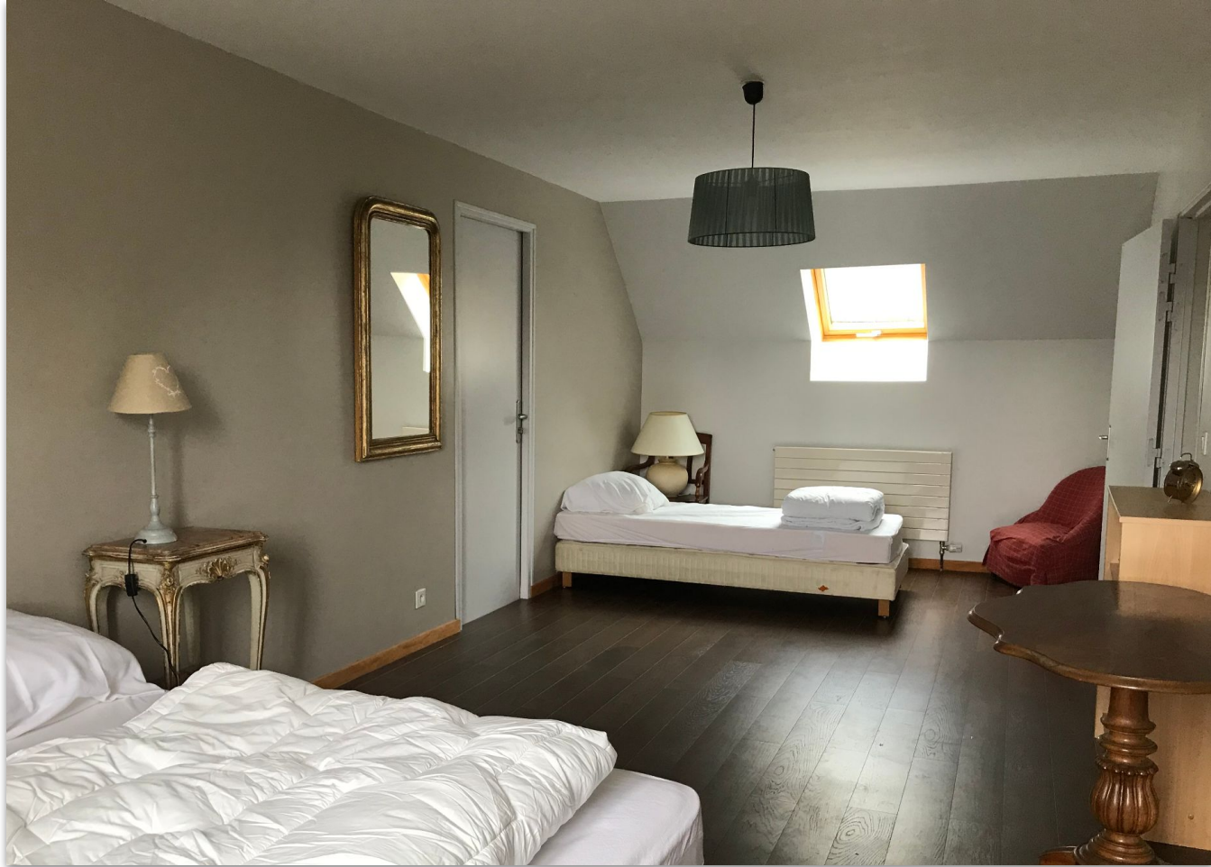
chambre double (deux lits simples)