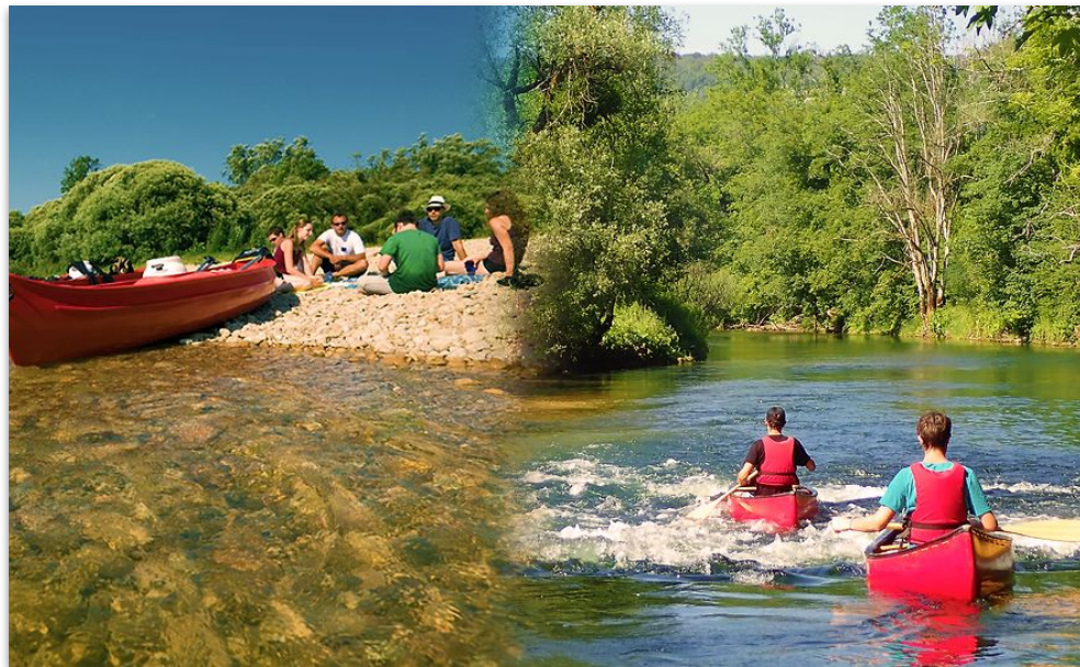
Canoë-kayak à Ounans (9km) - l'une des excursions part de Cramans