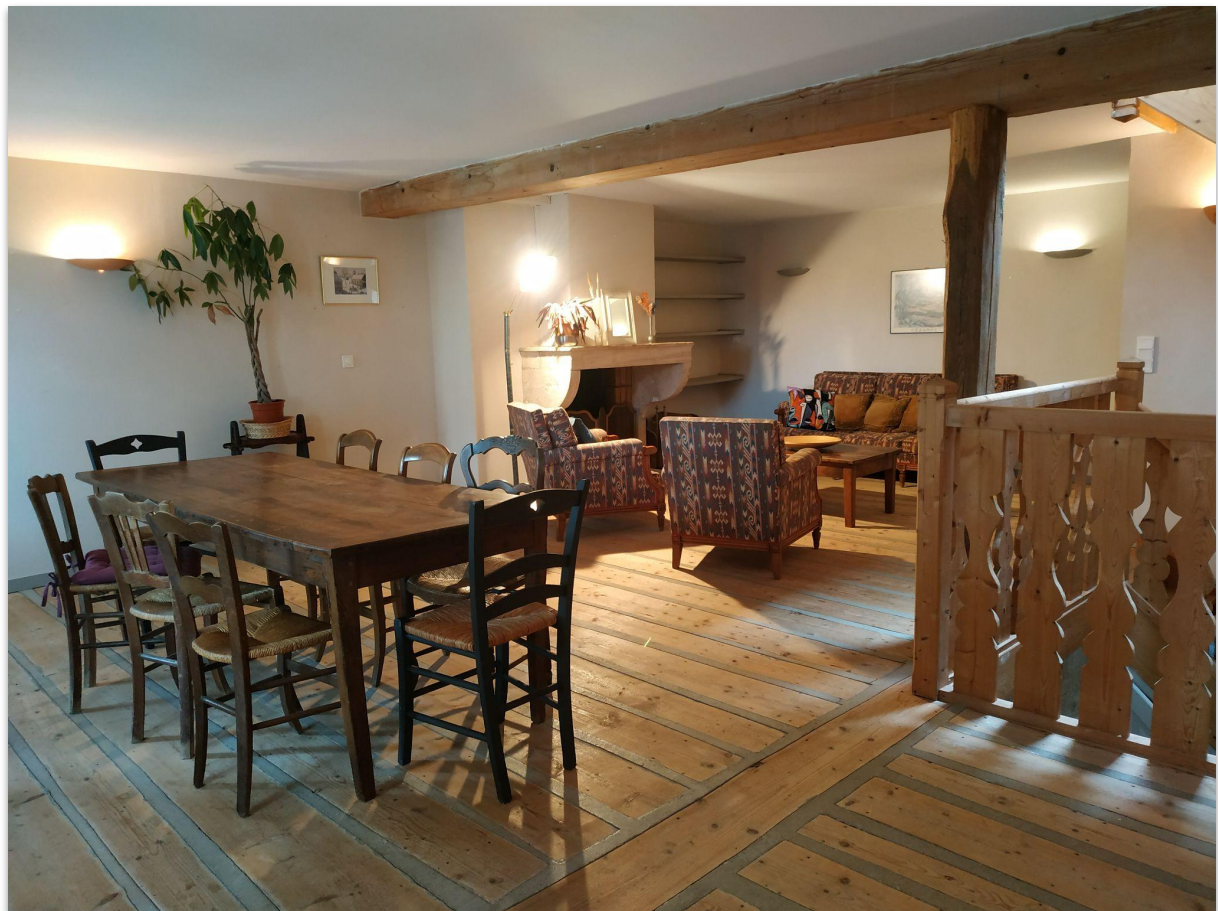
1er étage : pièce à vivre