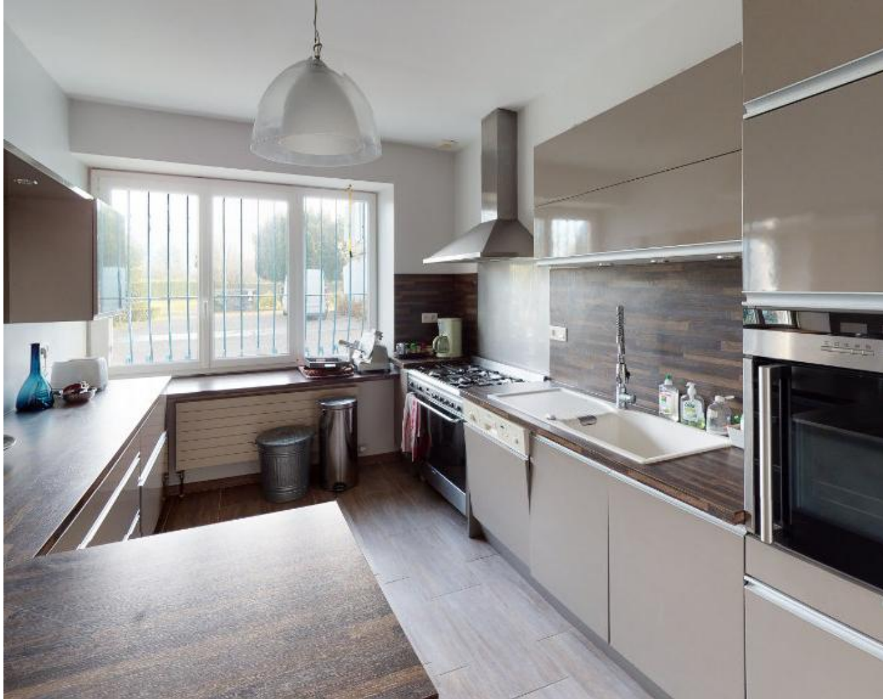
RDC : Cuisine semi-ouverte sur la pièce à vivre