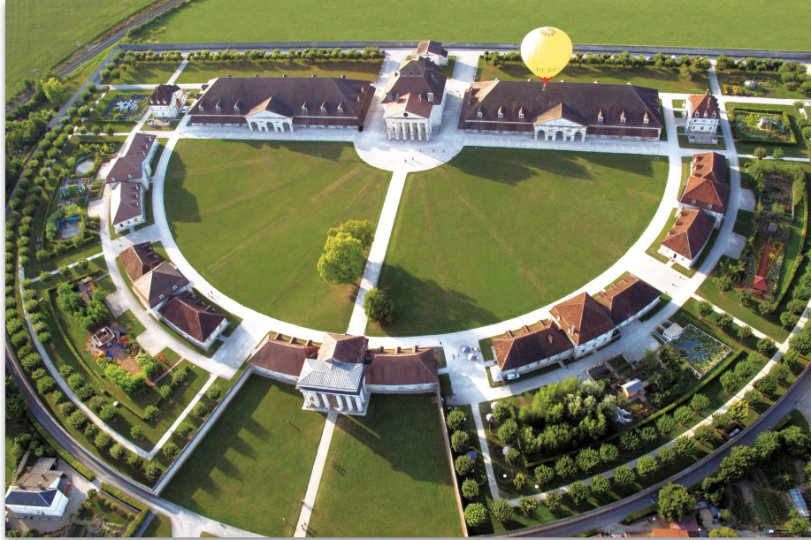
La Saline Royale d'Arc-et-Senans (3km), avec ses installations en permaculture et ses événements culturels