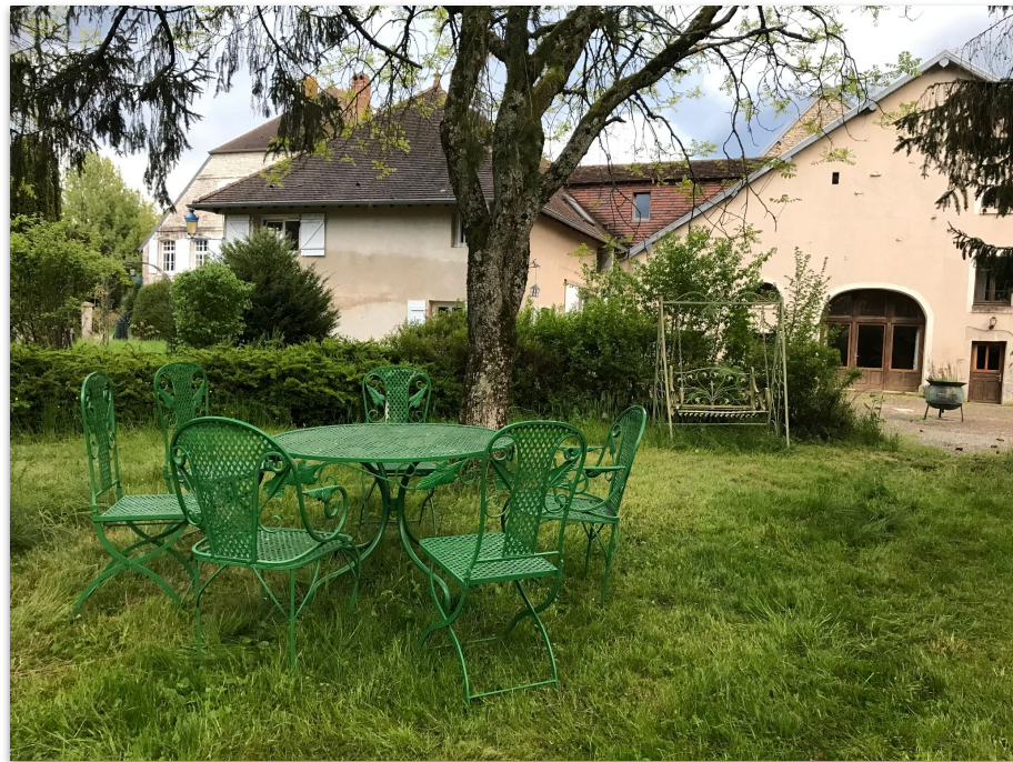
Cour privée du Grand gîte et de la Maissonnette, espace pour manger à l'ombre des arbres