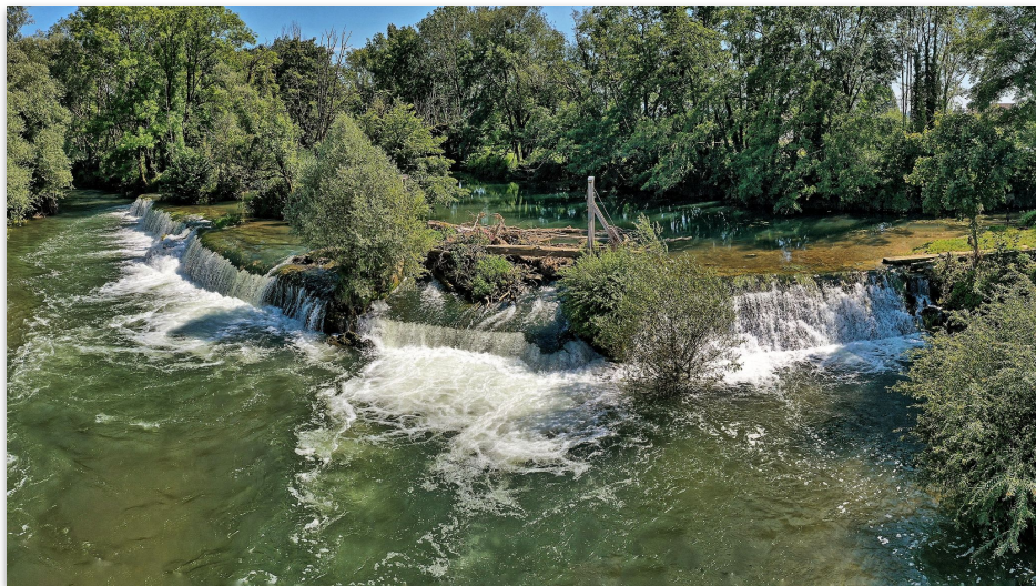
Baignade dans la Loue au Moulin Toussaint (1km)