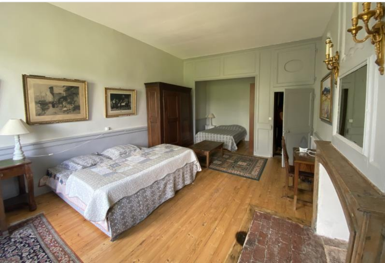
chambre quadruple et sa salle de bain