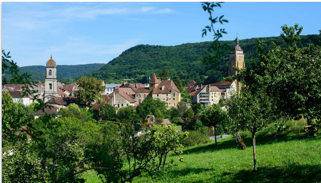
Arbois et ses vignobles, départ de la route des vins (14km)