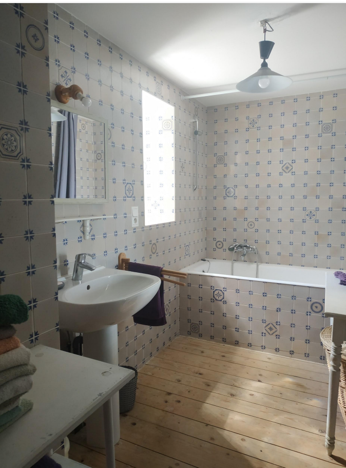
1er étage : salle de bain