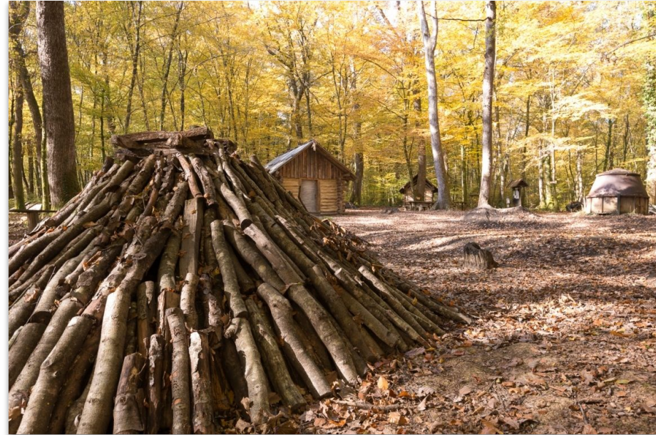
La forêt de Chaux (6km) et ses “baraquas du 14” (ancien hameau à visiter, à 16km)